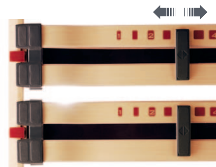
Je nach Wölbung der Lendenwirbelsäule werden die Leisten in Höhe und Festigkeit justiert