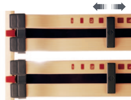
Je nach Wölbung der Lendenwirbelsäule werden die Leisten in Höhe und Festigkeit justiert